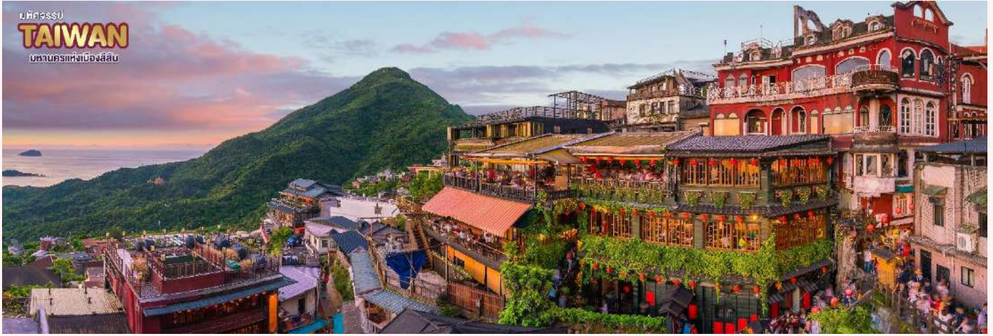
บริษัทจรรยา TAIWAN มหานครแห่งเมืองสี่สิบ

จากนั้น นำท่านเข้าพักที่ เมืองเกาหยวน หรือเทียบเท่าตามมาตรฐานได้วัน